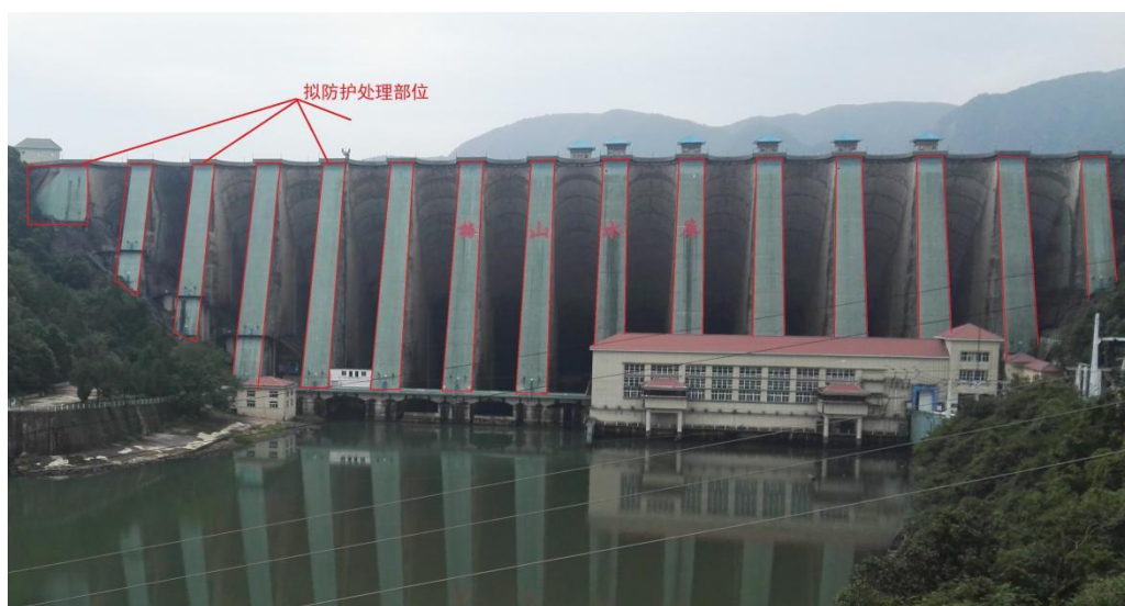
拟防护处理部位图