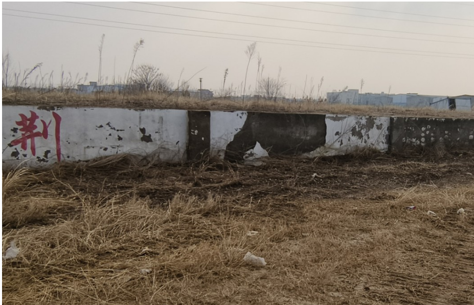
荆山管理所北侧料池现状

2. 翻修荆山管理所北侧物料池，将挡墙外侧损毁的砂浆层铲除，清理墙体底层，满铺钢丝网，采用 20mm 厚防水砂浆防水兼找平层一道+1.0mm 厚外墙防水涂料一道。外墙防水涂料材料选用、材料品控、构造做法参照《建筑外墙防水技术规程》第 4、5 章相关内容。