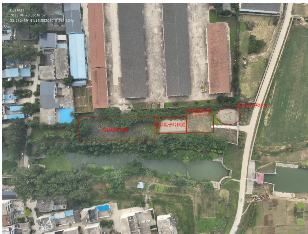
长流沟涵储备点航拍图

长流沟涵储备点现储备有块石、碎石（大石子）、碎石（瓜子片）黄砂，现状黄砂、碎石（瓜子片）料池损坏，碎石（大石子）料池较矮，块石堆放比较杂乱、无料池，储备点布局不合理，块石、碎石（瓜子片）调运无进出场道路。