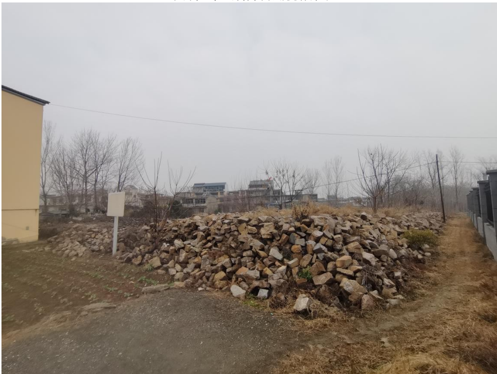
白洋沟涵储备点料池现状