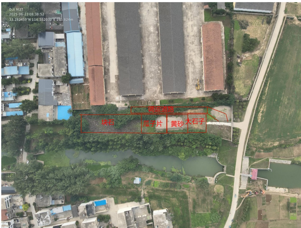
长流沟涵储备点料池布置示意图

储备点北侧新增块石调运出入口及大门、调运道路硬化，现状料池拆除，新建浆砌石料池（利用现场块石），料池周边铺设草皮。