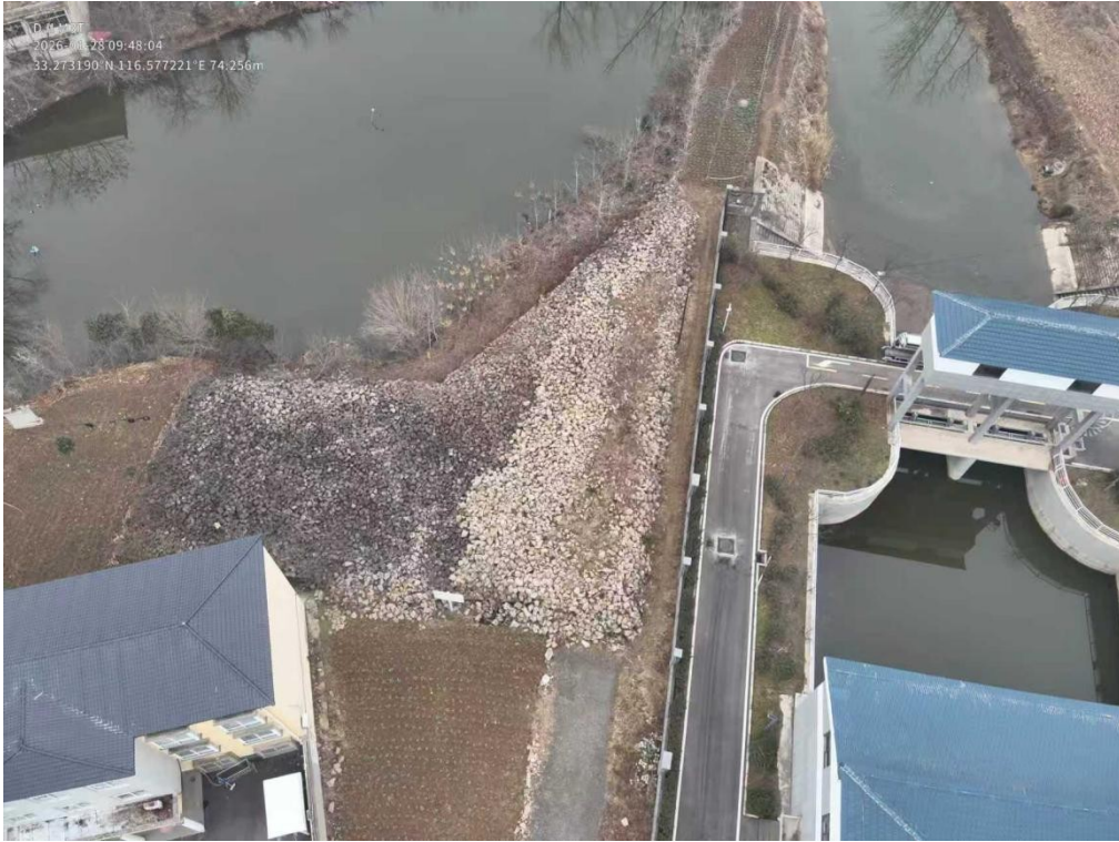
白洋沟涵储备点航拍图

长流沟涵储备点现储备有块石，现状白洋沟料场调运道路较窄（宽度 2.5m）、不方便调运车辆通行，块石堆放不齐、无料池。