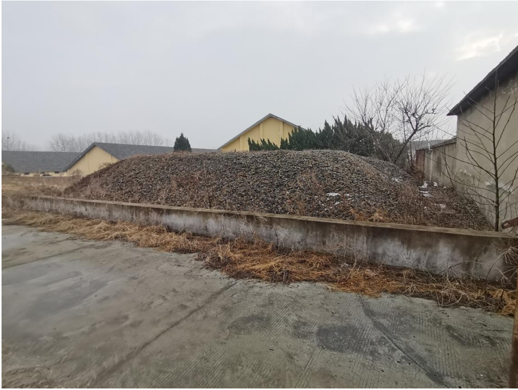
长流沟储备点碎石（大石子）料池现状照片