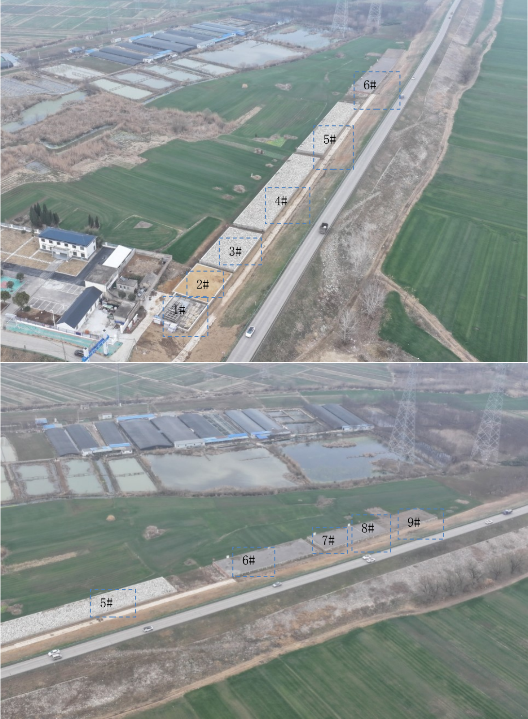
6. 上桥站料池拆除重建及防汛调运道路平面位置示意图