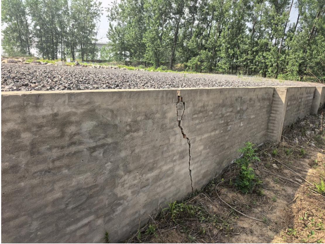
东淝闸省级防汛物资储备点整体布置图