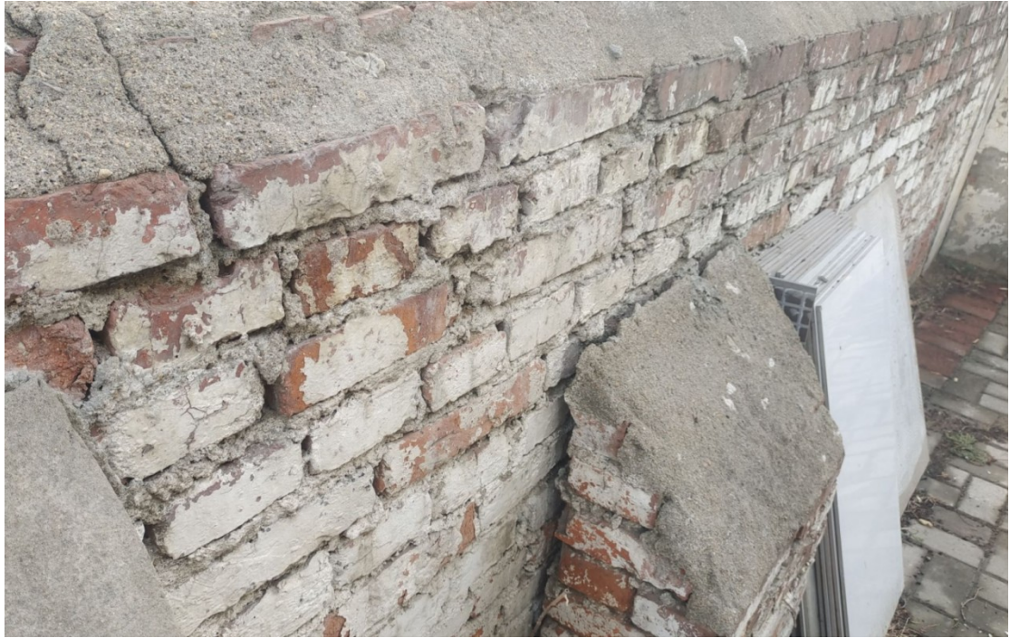
荆山管理所料池现