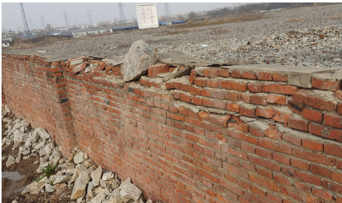
上桥管理所料池现状

荆山省级防汛物资储备点位于怀远县荆山管理所内（禹王西路 688 号），储备时间是 2001 年。因荆山管理所改造提升项目，需将物料转运至淝南管理所和上桥管理所物料池。经勘察，要转运的料池经多年风雨侵蚀，部分挡墙粉刷层脱落、墙体倾斜变形损毁，暴雨时砂石料从缺损处流失。储备点料池“一字”排列，部分料池无调运道路，防汛应急抢险调运困难。为解决防汛物资储备规范化和抢险调运困难的问题，建议对该处防汛物资储备点料池和道路进行维修改造。