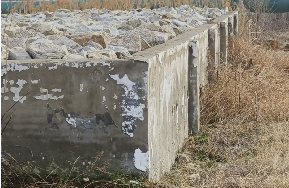
荆山管理所北侧料池现状

3. 拆除上桥管理所6#料池砖砌挡墙，采用青灰色砖重新砌筑，池内侧每3米长设拉结墙1道，料池砖墙每4层砖设 \varnothing 6 拉结筋两道，池内、背侧挂钢丝网防水砂浆粉刷，粉刷层厚度2cm；临堤侧砌砖墙勾缝，每两座物料池中间设1.5米宽人行便道，砖砌料池总长度共约90米，料池高度为1.5m（地下基础埋深0.3m，地面上1.2m），料池顶为M10砂浆压顶，压顶厚6cm，料池底部低于平均高程回填基础土压实度0.92，料池背侧采用堤脚处渣土回填，回填至料池挡墙露出地面，在料池距地面25cm处设 \varnothing 75 的排水管，排水管间距约3.0m；并对黄砂、碎石及瓜子片等防汛物料进行整平。