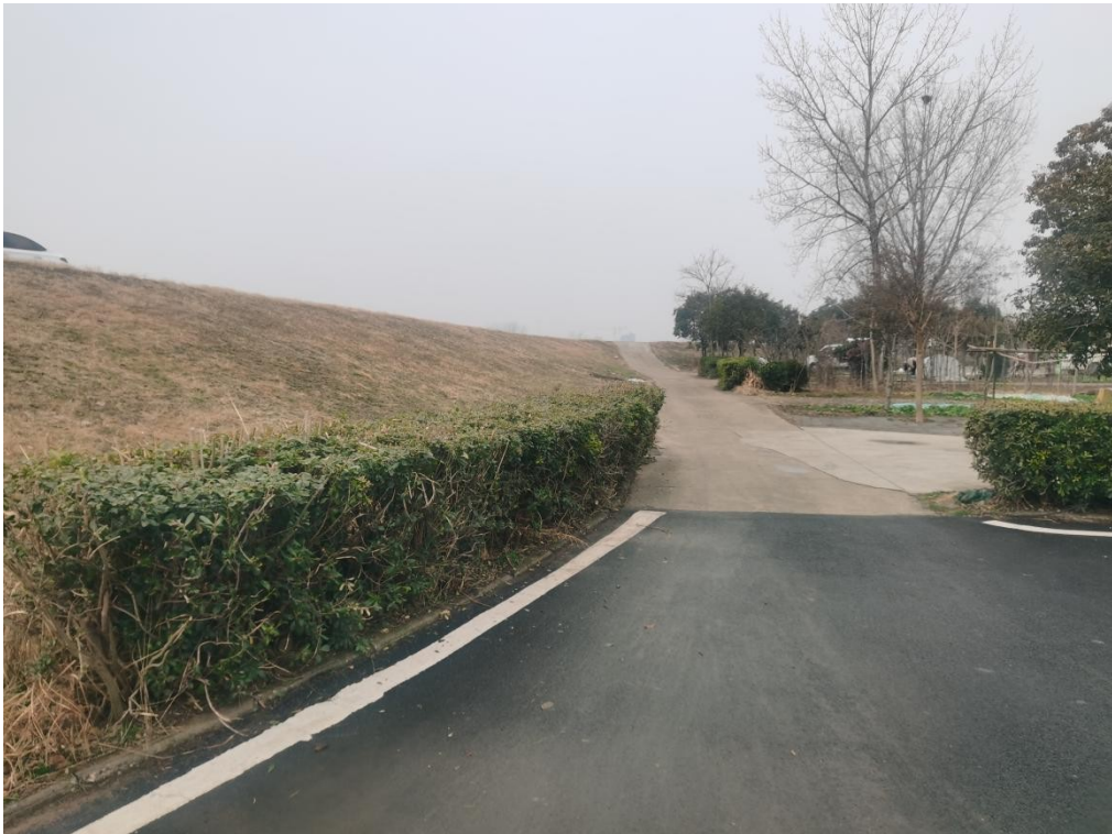
白洋沟涵储备点调运道路现状