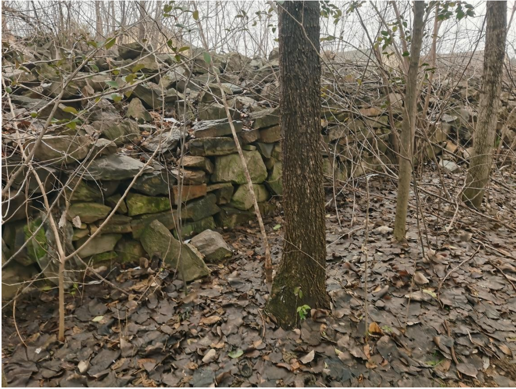
长流沟储备点块石料池现状照片