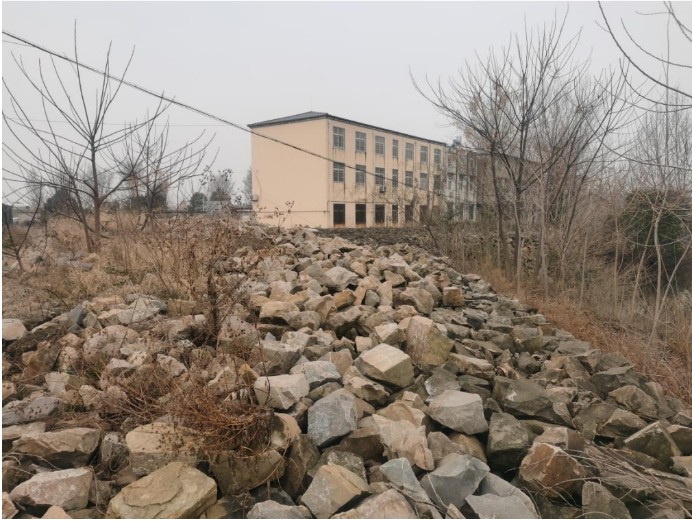
白洋沟涵储备点块石现状