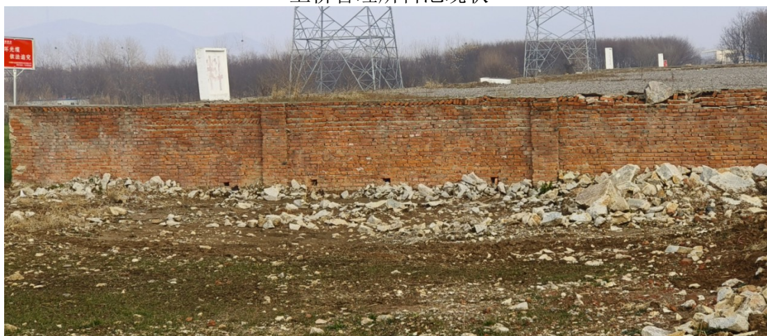
上桥管理所料池现状