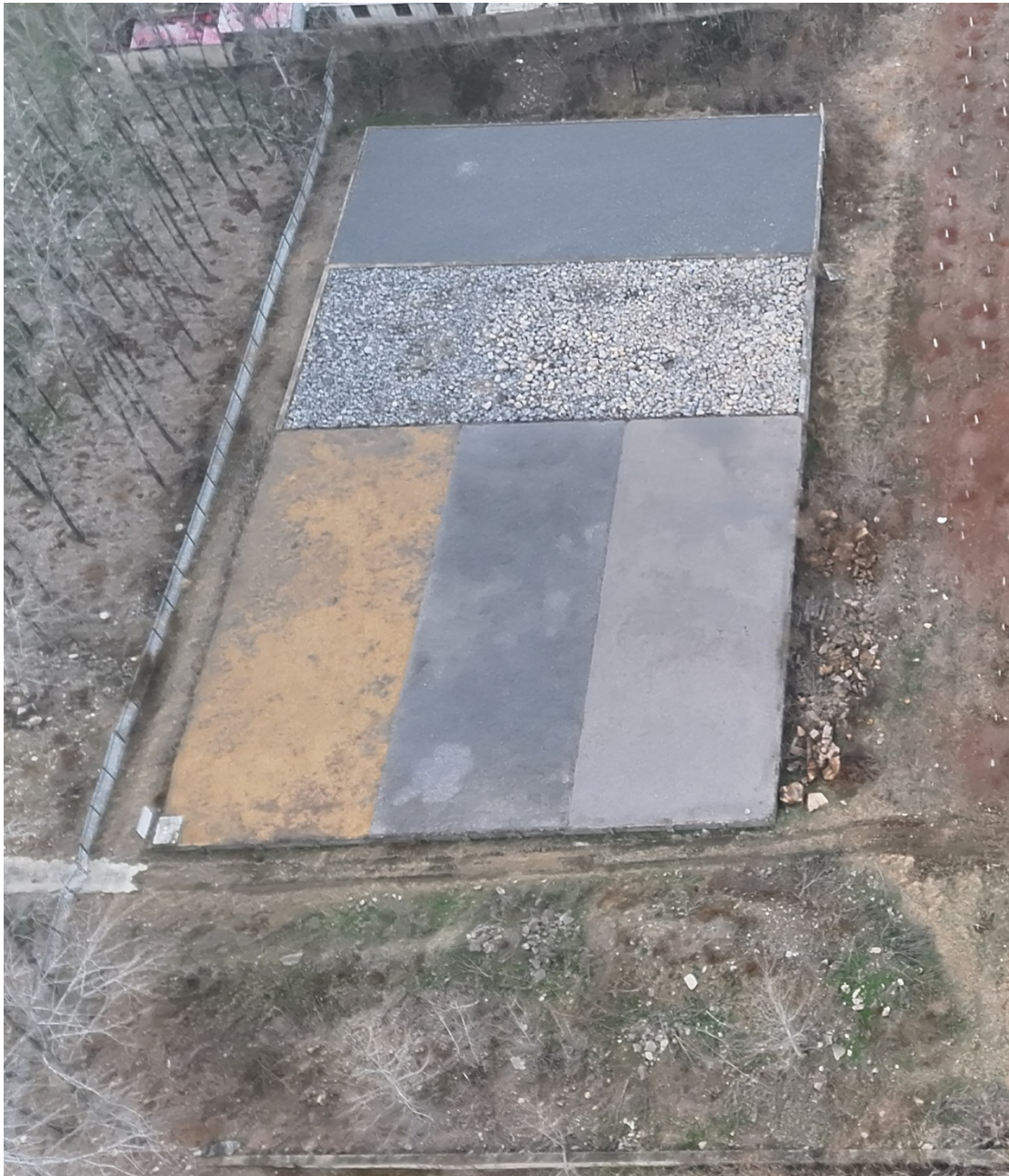
料池挡墙长 74m，宽 43m，高 1.2-1.8m。