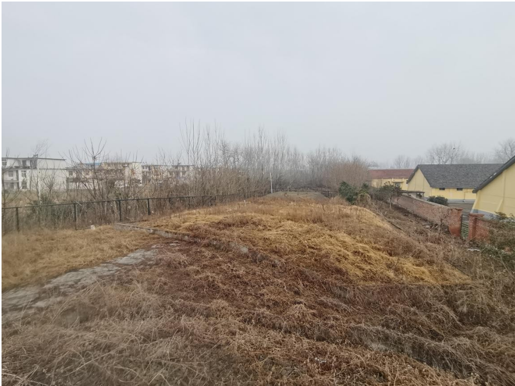
长流沟储备点黄砂、碎石（瓜子片）料池现状照片