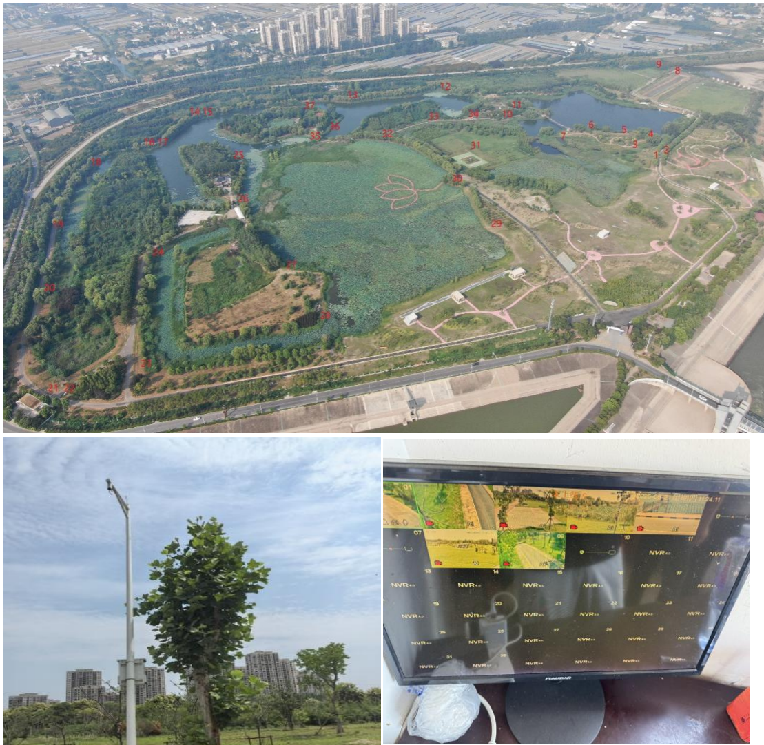
蚌埠闸管理处北岸院区部分监控设施现状