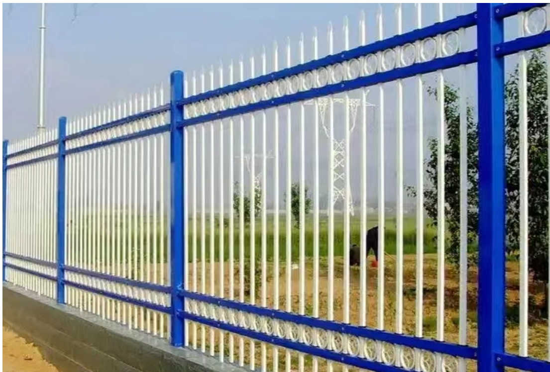
不锈钢护栏效果图

竖向栏杆间距 100mm，不锈钢厚度不小于 1mm；要求栏杆设置牢固，满足使用要求，具体样式见效果图。材料进场前需经管理单位审核同意后实施；